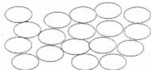
INICIO FORMAÇÃO DO FILME

Continuação da evaporação e início da polimerização, (união de várias moléculas para a formação de uma molécula maior ou neste caso um filme)