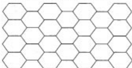
FORMAÇÃO CORRETA DO FILME

Continuação da evaporação e início da polimerização, (união de várias moléculas para a formação de uma molécula maior ou neste caso um filme)